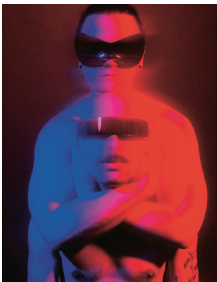
„DJ“-Duo Slutty Saints

Curated by Samira Saad & Christian Haselmayer Eintritt frei | Free admission Full Line-up & Infos: crossingeurope.at/nightline