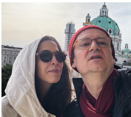
popfest curators' disco